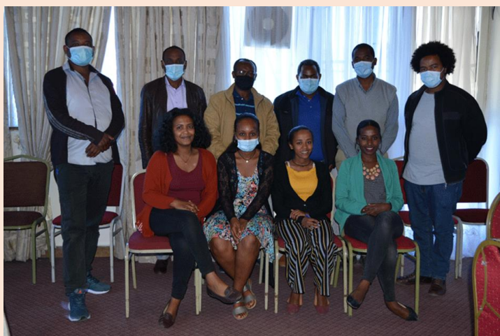
Organized Review meeting.

Einen besonderen Schwerpunkt legt die Organisation auf das Thema der Schulbildung für Mädchen . Hiwot arbeitet daran, das Bewusstsein für Bedeutung und die Chancen von Bildung für Mädchen zu erhöhen und ihnen ein sicheres Umfeld in der Schule selbst zu verschaffen.