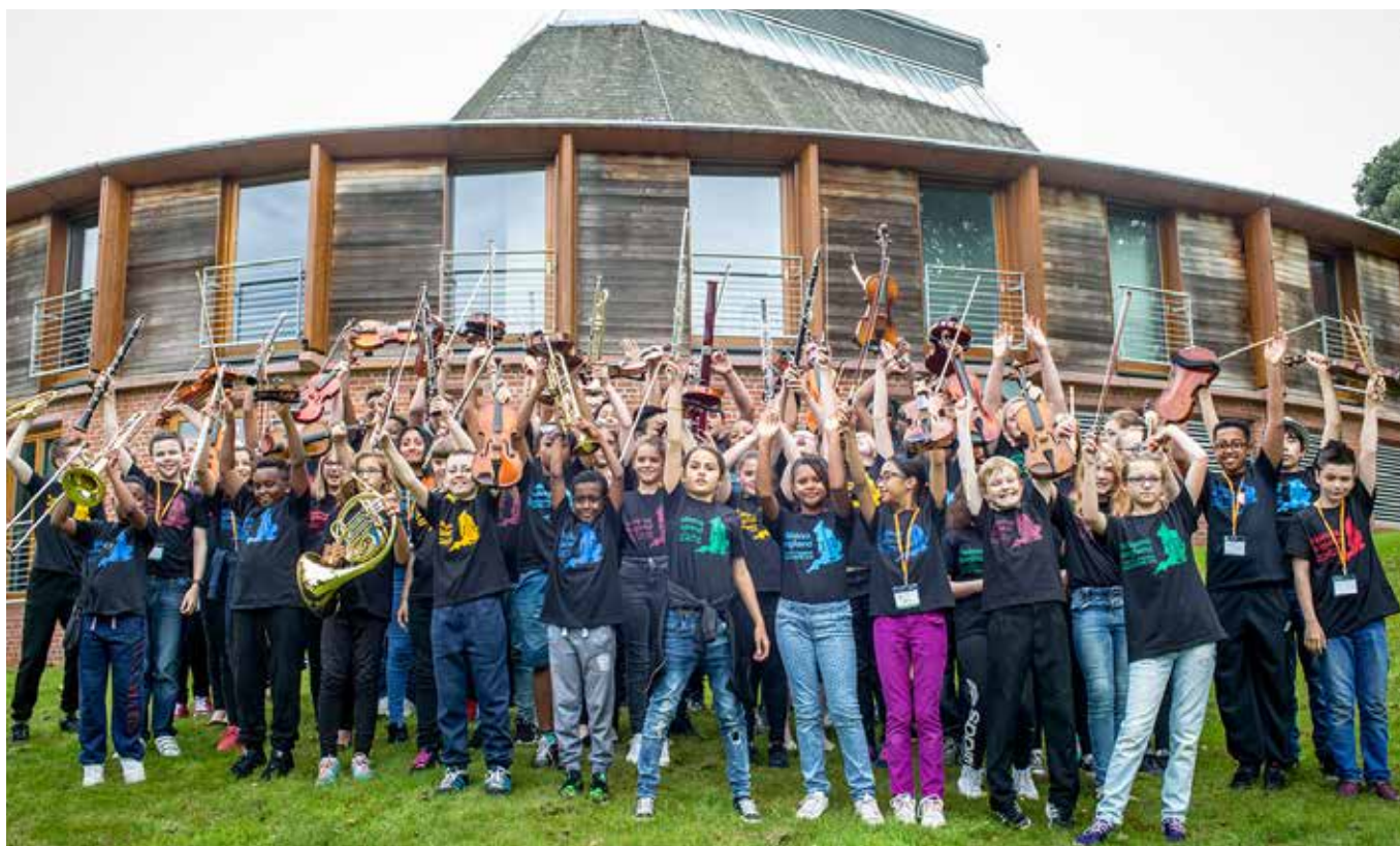
Sistema Young Leaders in England, wo im August 2018 das Sommercamp von El Sistema Europe stattgefunden hat.

Gemeinschaftssinn, Verantwortungsbewusstsein, Zielstrebigkeit und nachhaltiges Denken sind zusammen mit positiven Zukunftsperspektiven Ergebnisse, die die Menschen und ihre Umwelt nachhaltig verändern. Die Studierenden aus der Projektgruppe „music4sustainability“ des Masterstudiums Global Studies an der Karl-Franzens-Universität Graz haben sich im Sommersemester 2019 schwerpunktmäßig mit dem El Sistema Prinzip beschäftigt (siehe Beitrag auf der nächsten Seite unten). Sie stellen einzelne Ergebnisse in eigenen Workshops am FairStyria-Tag vor und steuern so einen „Nachhall“ zur Nachhaltigkeit der steirischen Entwicklungszusammenarbeit bei.