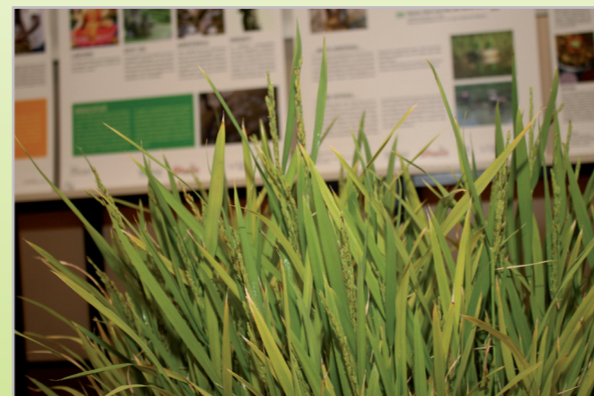
Reis ist in vielen Ländern das wichtigste Grundnahrungsmittel

Kosten: € 100,- pro Workshop inkl. Unterrichtsmaterial